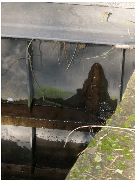
Místo poškození – průsaku v levém stavidlu