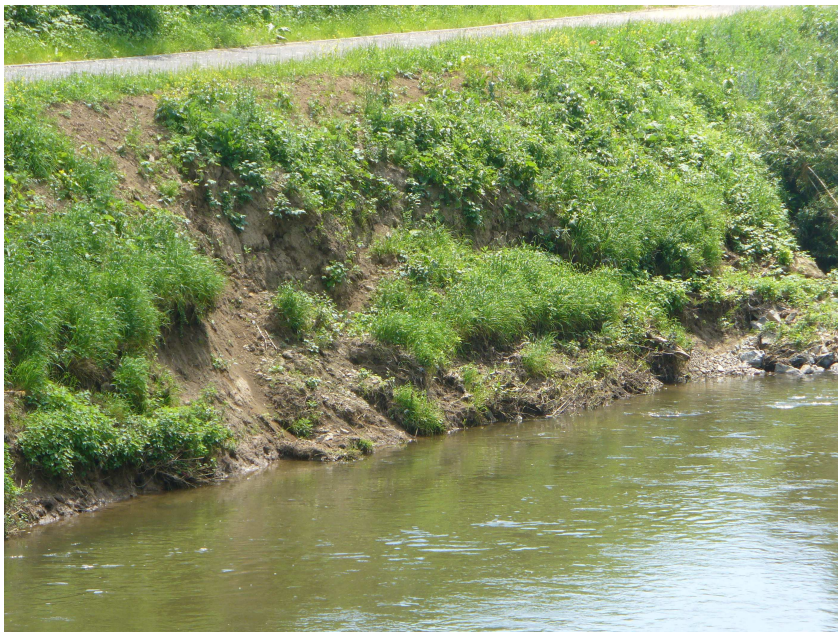
Sesuv břehu v místě probíhající stavby CS

Zkušenost z této údržby bude ve prospěch správy toku promítnuta do příslušných pasáží Provozního řádu CS.