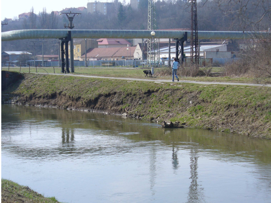
Nátrž v hrázi