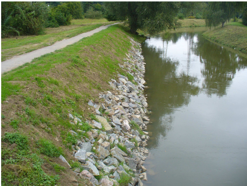
Sanovaná pata hráze