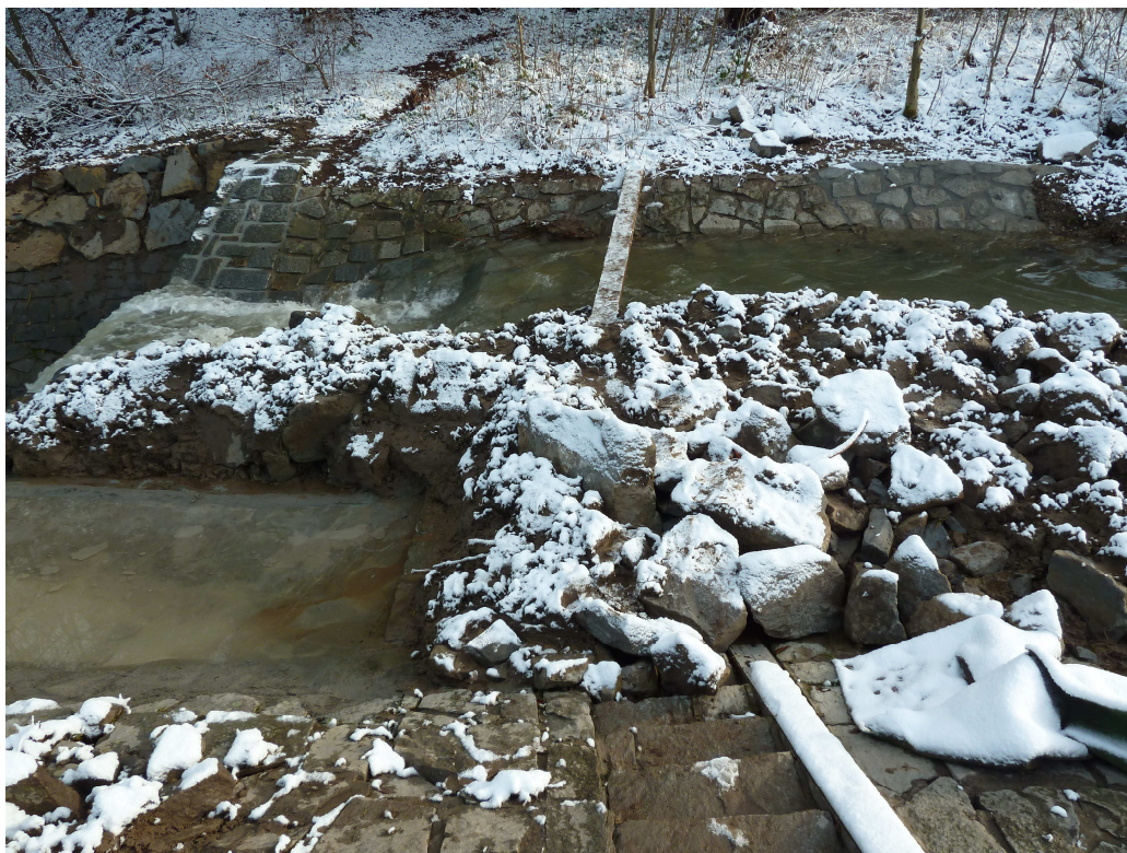
Oprava přelivné hrany kamenného stupně u LG stanice Rajnochovice